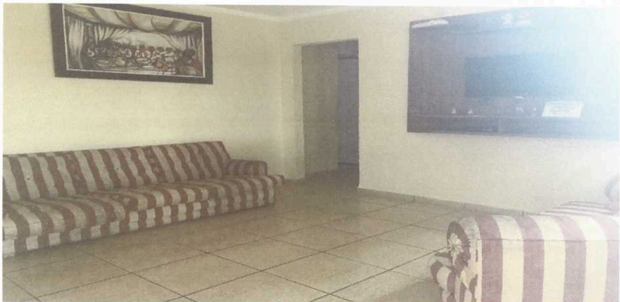
Imagem 6. Sala de TV do Dormitório masculino e/ ou feminino da Associação Casa Naim Salto.