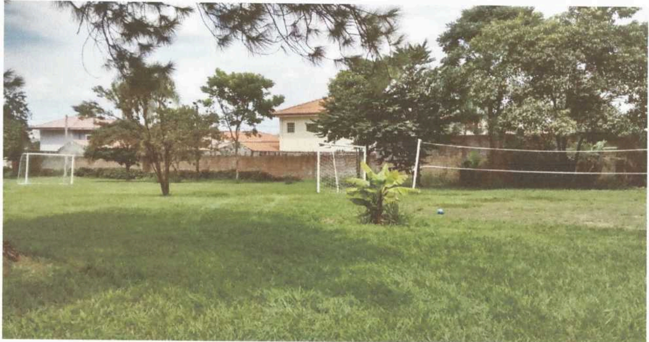
Imagem 5. Área externa e de lazer da Associação Casa Naim Salto.