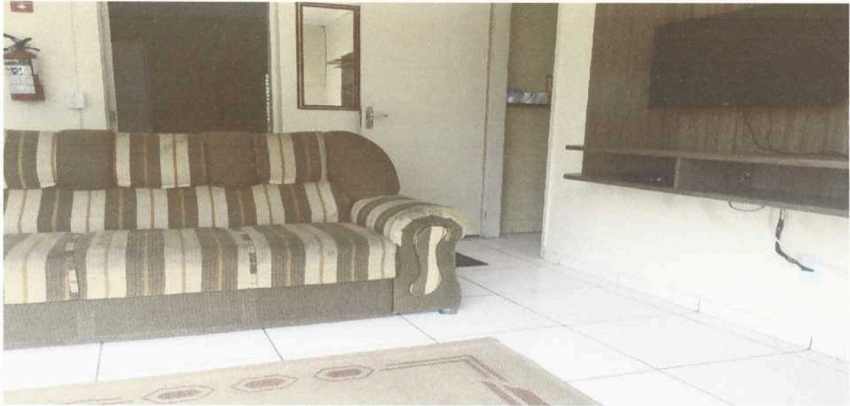
Imagem 7. Sala de TV do Dormitório masculino e/ ou feminino da Associação Casa Naim Salto.