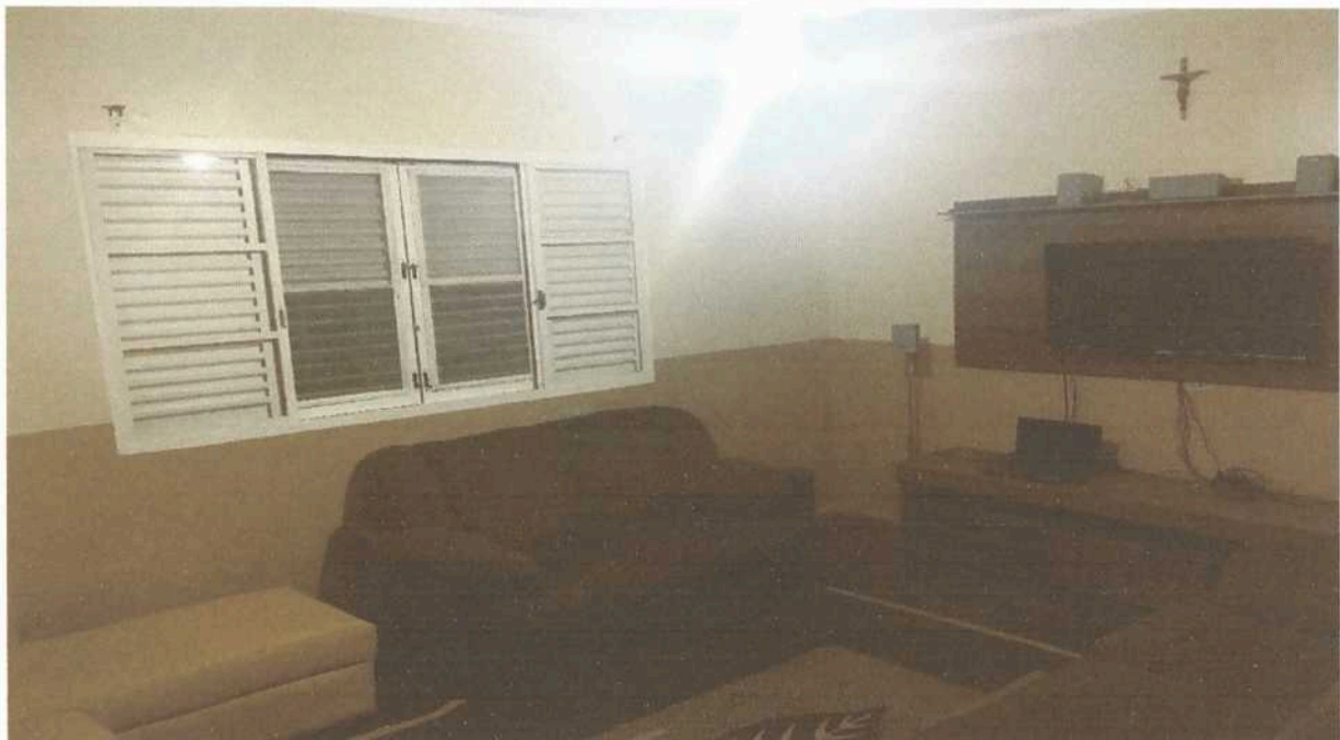
Imagem 8. Sala de TV da casa sede da Associação Casa Naim Salto.