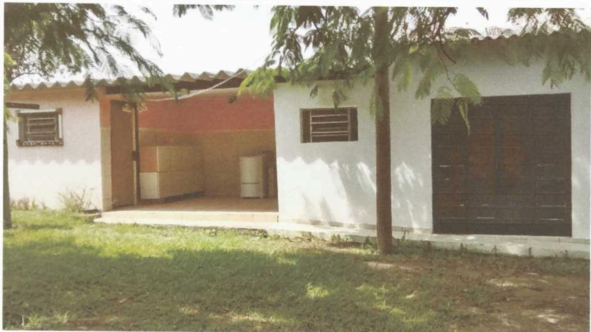
Imagem 2. Lavanderia Doméstica e Industrial da Associação Casa Naim Salto.