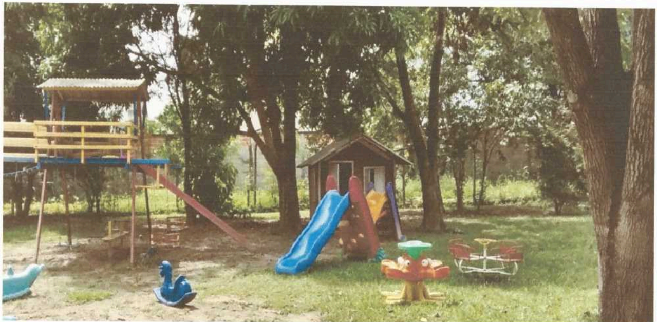
Imagem 4. Área externa e de lazer da Associação Casa Naim Salto.