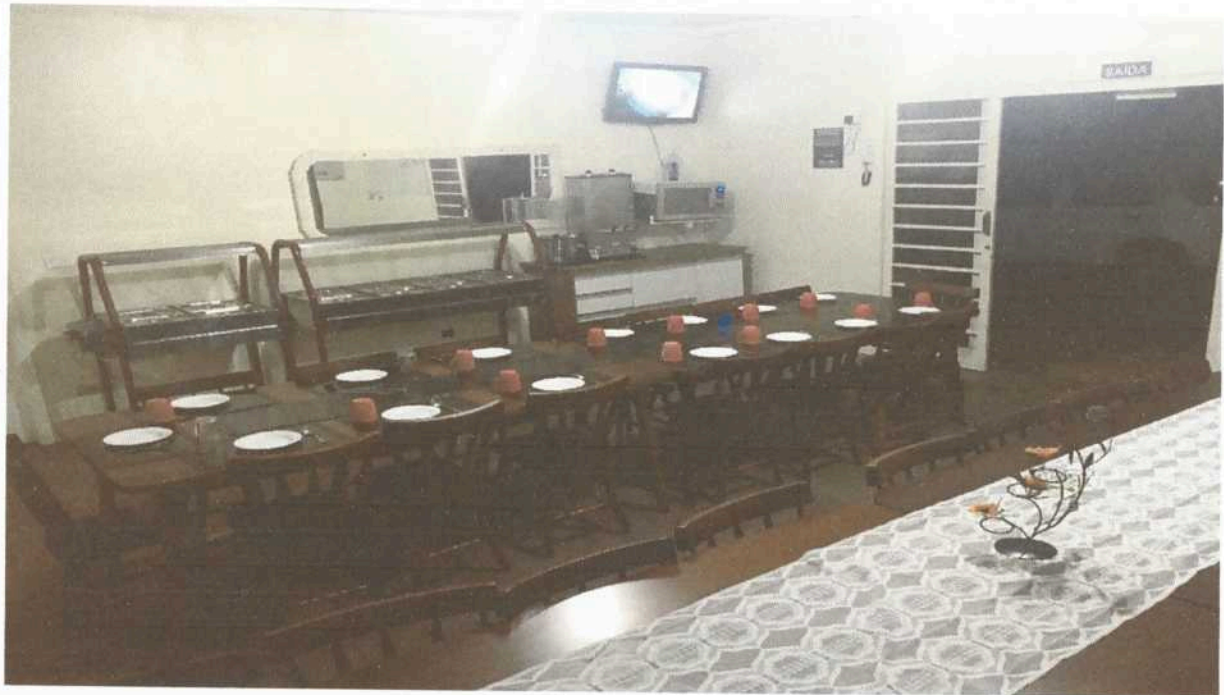
Imagem 1. Refeitório Associação Casa Naim Salto.