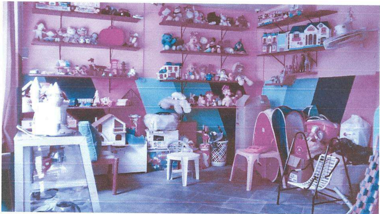
Imagem 2. Brinquedoteca da Associação Casa Naim Salto.